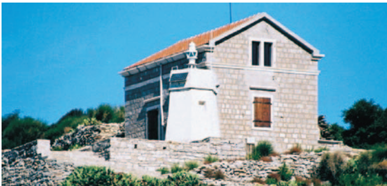
OBALNO SVIJETLO "SV. NIKOLA" BUDVA

Sve trajne promjene na objektima pomorske rasvjete, odnosno ispravke, objavljuju se u "Oglasu za pomorce", koji služi za ažuriranje pomorskih karata, dok se ostale informacije vezane za sigurnost i bezbjednost plovidbe emituju preko "Radio oglasa" obalne radio stanice "BARRADIO".