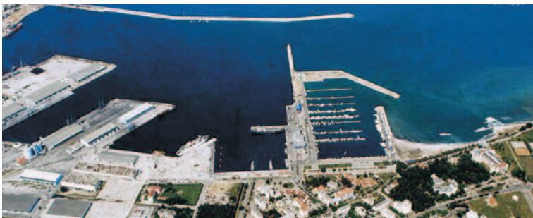
MARINA U BARU

Raspolažu dobrim vezovima, navozima i dizalicama, pumpama za snadbijevanje plovnih objekata gorivom, radionicama za opravku jahti i čamaca, prodavnicama specijalizovane opreme za jahte i čamce, restoranima, kafićima itd.