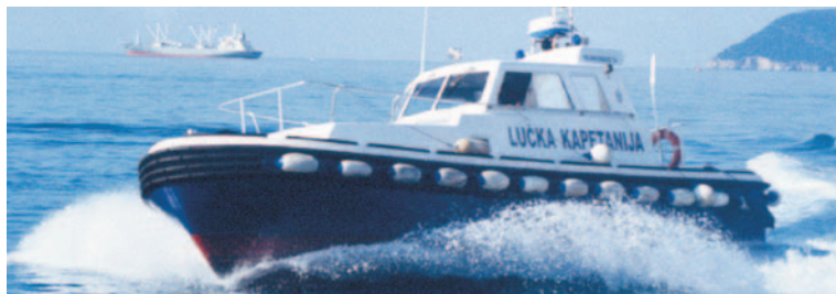
ČAMAC LUČKE KAPETANIJE BAR

Lučka kapetanija Bar (ispostave Ulcinj, Budva i Virpazar), kao i Lučka kapetanija Kotor (ispostave Tivat, Zelenika i Herceg Novi), vrše inspekcijski nadzor nad primjenom propisa kojima se uređuju odnosi u obalnom moru i unutrašnjim vodama Crne Gore.