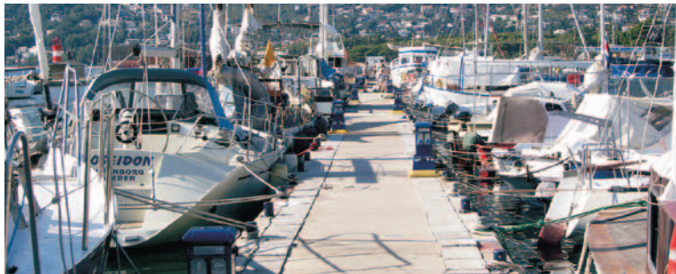
MARINA U BARU

Prilikom isplavljenja treba dobro pogledati gdje su konopi za vez, koliko su blizu propeleru a naročito jesu li isprepletani. Uplovljenje je, za razliku od isplavljenja, donekle teže. Običaj je dolaziti krmom na gat, ali to nije uvijek lako. Treba sve predvidjeti – odakle duva vjetar, kakav je izbor propelera, koliko je mjesta itd. Ako vas situacija ne čini srećnim i niste sigurni da će sve ići glatko, uplovite pramcem. Manevar je sigurno lakši.