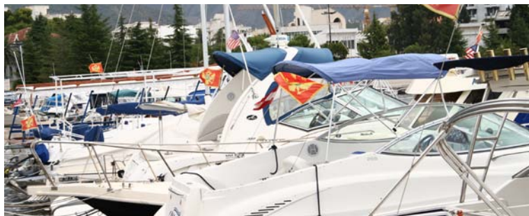
MARINA U BARU

Na brodu se može svašta neplanirano dogoditi i zato svu opremu koju brod nosi treba držati uvijek na istom mjestu. Jedino je tako moguće dobiti pravi komad alata ili sigurnosne opreme u ruke. Baš zbog toga ne treba brod pretrpavati sa svim što vam padne na pamet.